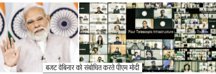
बजट वेबिनार को संबोधित करते पीएम मोदी

पीएम ने कहा कि पिछले कुछ वर्षों में देश का हेल्थ इन्फ्रास्ट्रक्चर काफी मजबूत हुआ है और सैकड़ों जिलों में नए मेडिकल कॉलेज खोले गए हैं। आयुष्मान भारत योजना के तहत आरोग्य मंदिरों से स्वास्थ्य सेवाओं की पहुंच गांव-गांव तक बढ़ाई गई है।