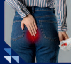
उल्टी या मल में खून आना