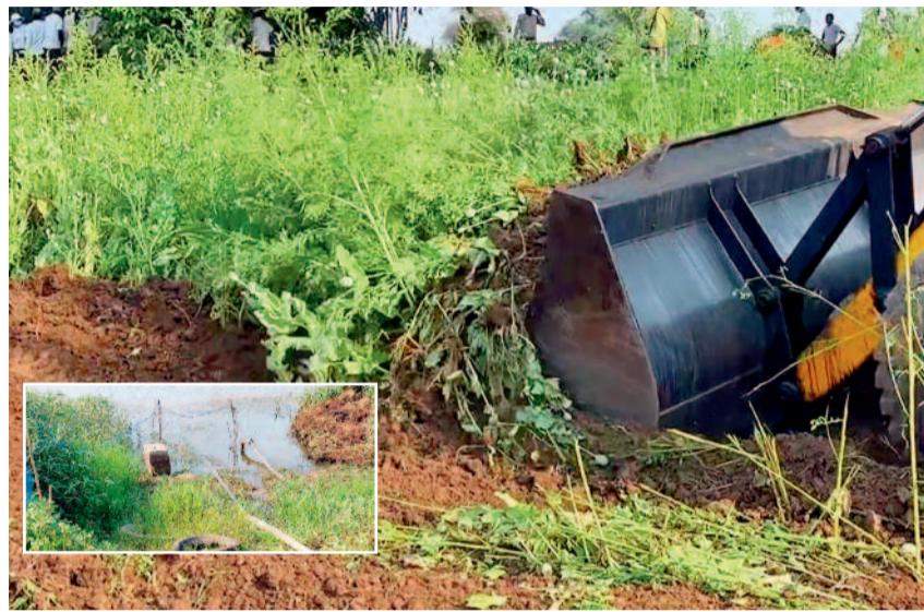
हरिभूमि न्यूज ►► मिललाई

दो दिन की कार्रवाई में 6 हजार किलो से ज्यादा का पौधा जब्त, कीमत 8 करोड़