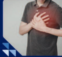
सीने में जलन जो लगातार बनी रहे

जब एसिडिटी ठीक नहीं होती, तो यह सिर्फ एसिडिटी से ज्यादा भी हो सकता है।