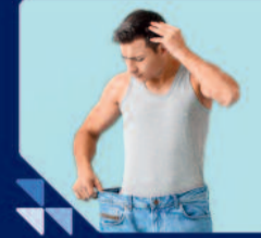
लगातार कमजोरी या बिना वजह वजन घटना