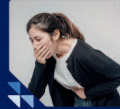
उल्टी जो ठीक न हो