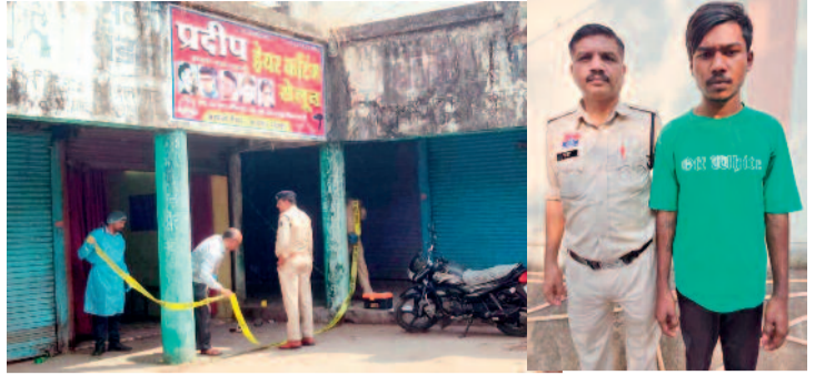
हरिभूमि न्यूज ▶▶ धमतरी

चार महीने पहले हंसिया से किए हमले का बदला लेने युवक ने सेलून में बाल कटवाने बैठे दूसरे युवक की गर्दन व पीठ पर चाकू उतार दिया। घटना में युवक गंभीर रूप से घायल हो गया। पुलिस ने आरोपी को गिरफ्तार कर लिया है।