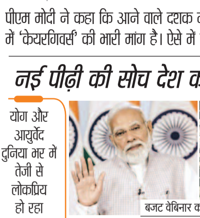
बजट वेबिनार को संबोधित करते पीएम मोदी

पीएम नरेंद्र मोदी ने सोमवार को बजट के बाद आयोजित 'सबका साथ, सबका विकास- लोगों की आकांक्षाओं को पूरा करना' विषय पर वेबिनार को संबोधित किया। उन्होंने कहा कि जन आकांक्षाओं की पूर्ति केवल चर्चा का विषय नहीं है, बल्कि यही इस बजट का मूल ध्येय और सरकार का संकल्प है। पीएम ने वीडियो कॉन्फ्रेंसिंग के जरिए कार्यक्रम को संबोधित करते हुए कहा कि जन आकांक्षाओं की पूर्ति का सबसे बड़ा माध्यम शिक्षा, कौशल, स्वास्थ्य, पर्यटन, खेल और संस्कृति जैसे मूलभूत सेक्टर हैं। इसी वजह से इस वेबिनार में इन महत्वपूर्ण क्षेत्रों पर विस्तार से चर्चा की जा रही है।